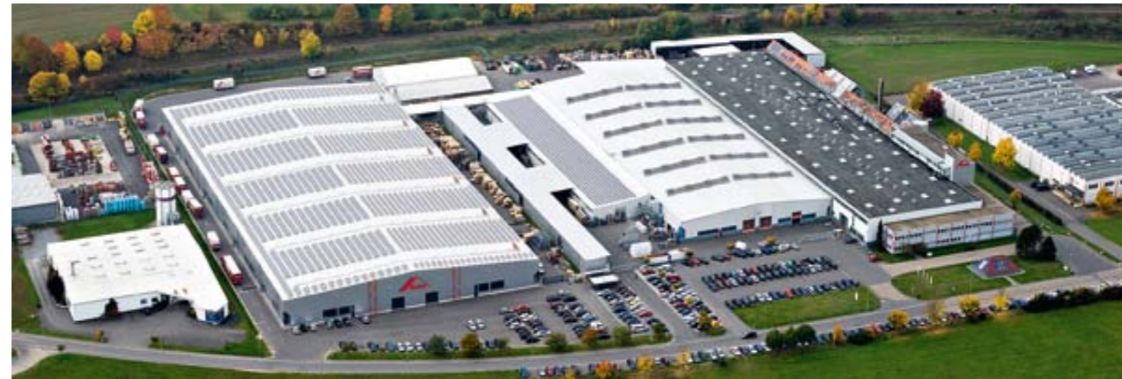
вверху: головное предприятие подразделения Roto FTT в Ляйнфельдене-Эхтердингене.